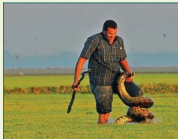
Anaconda's vangen in het moeras.