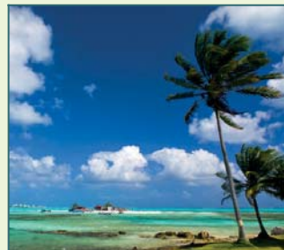
De stranden van San Blas.